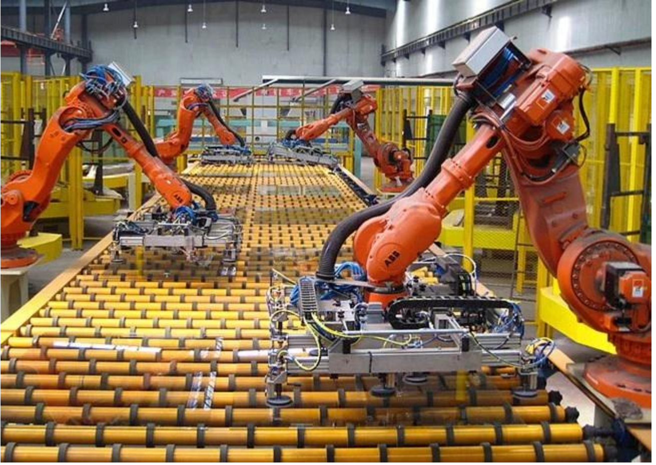
انخفاض الحديد تعويم الزجاج المستودع