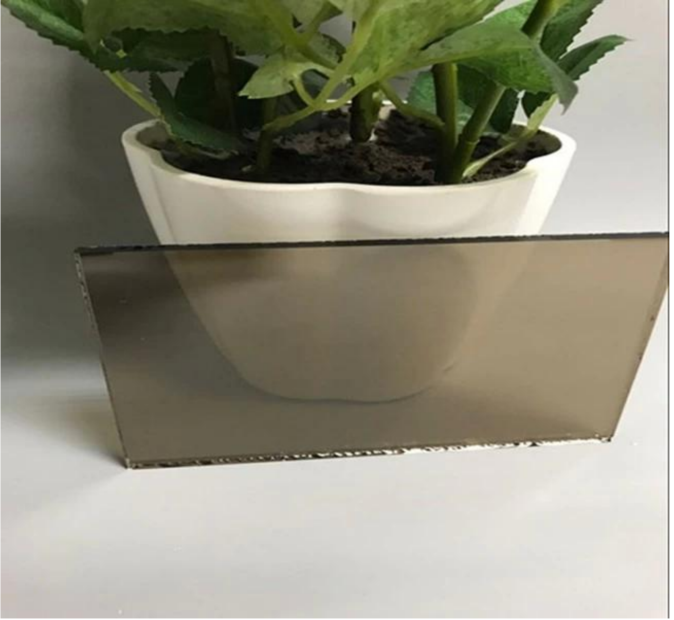
اليورو البرونزية الزجاج العاكسة IMM الجانب مرآة من 4