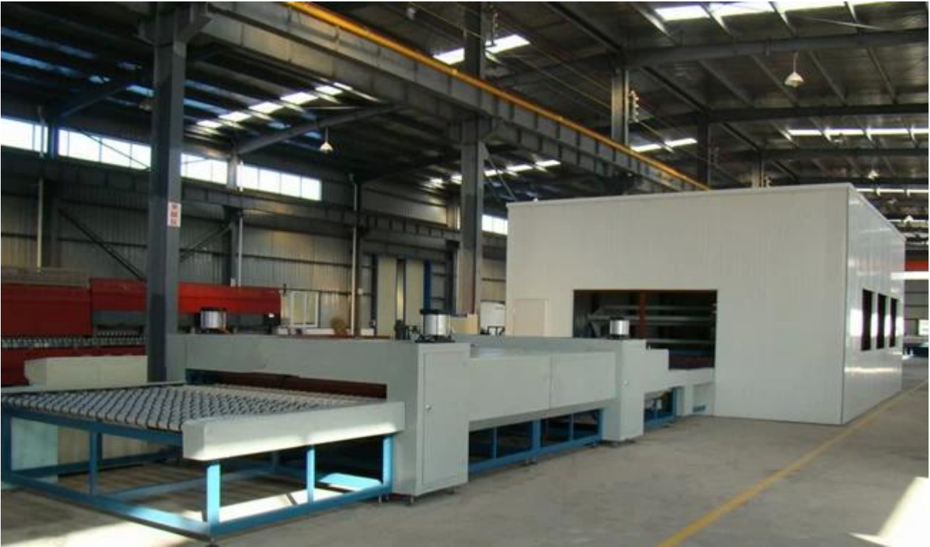
الأوتوكلاف الزجاج مغلفة