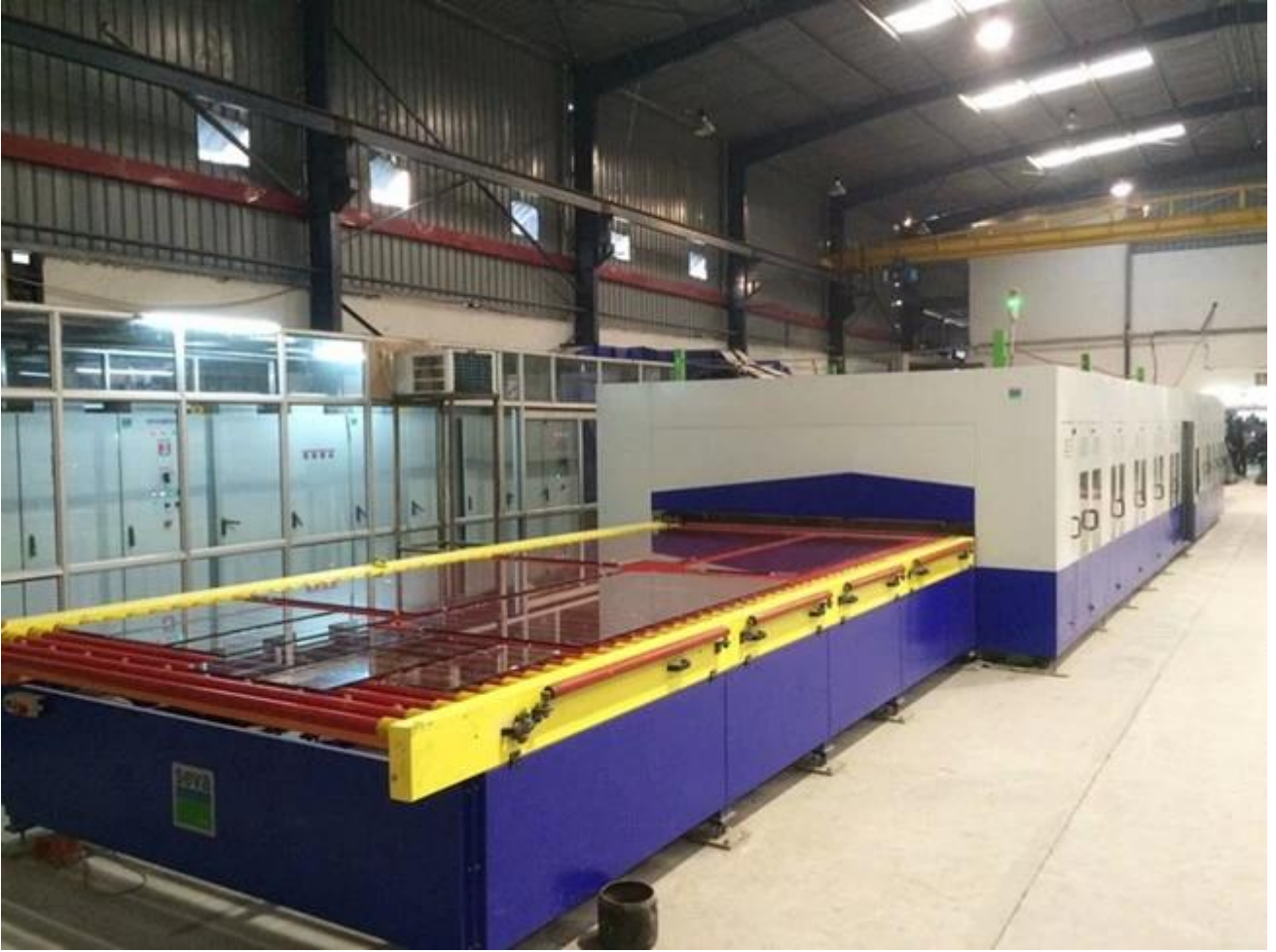
خفف من الزجاج سلامة التعبئة