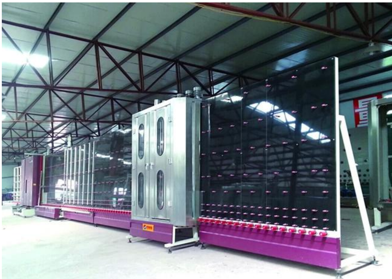
مستودع زجاج معزول