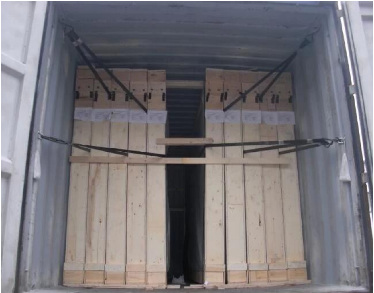
10mm Bronze glas für Balustrade