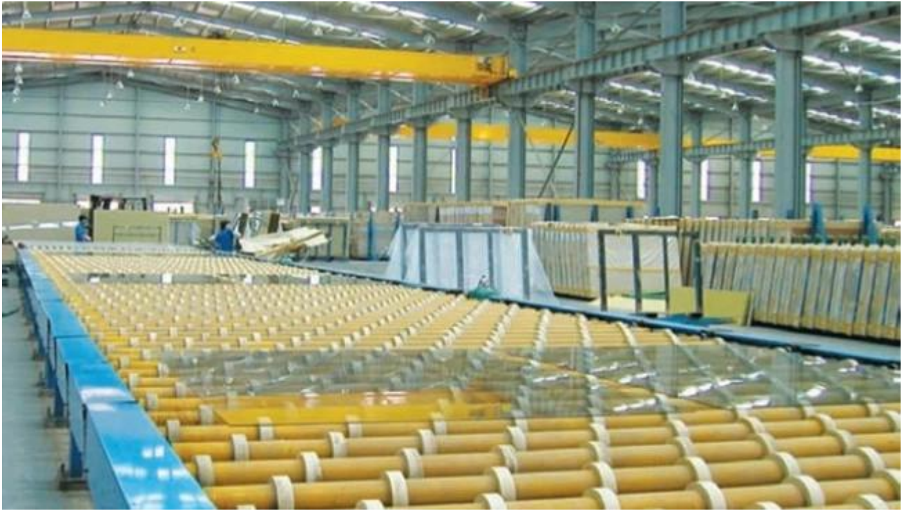
Glasverpackungen zu schweben