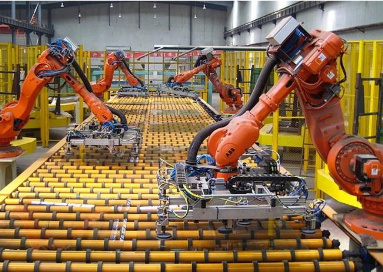
Eisearme Float Glaslager