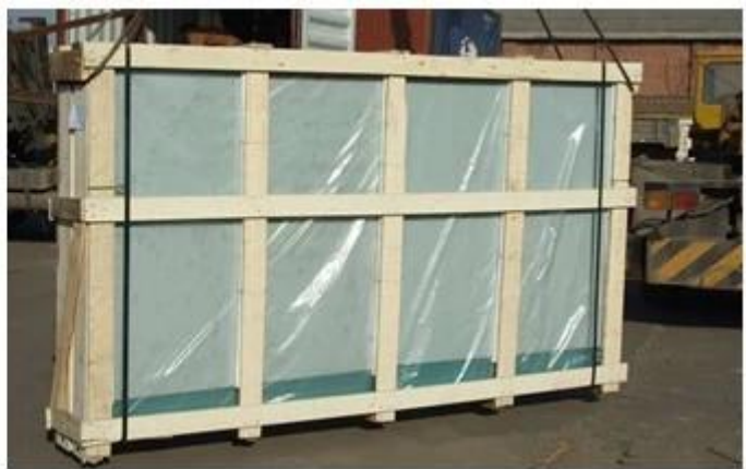
Hellgrün getöntes Glas Prozess Glas Anwendung: