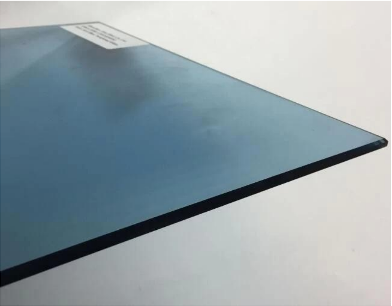
Gehärtetes Glas-Lager von JIMY Glas