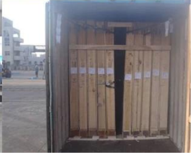
Anwendungen von 8,38mm Bronze laminierten Floatglas