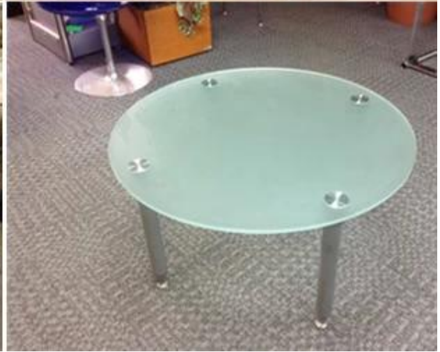
Kante und Ecke poliert