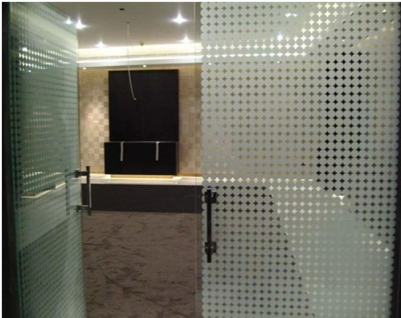
10mm Säure geätzt Hartglas für Wohnzimmer Schiebetür: