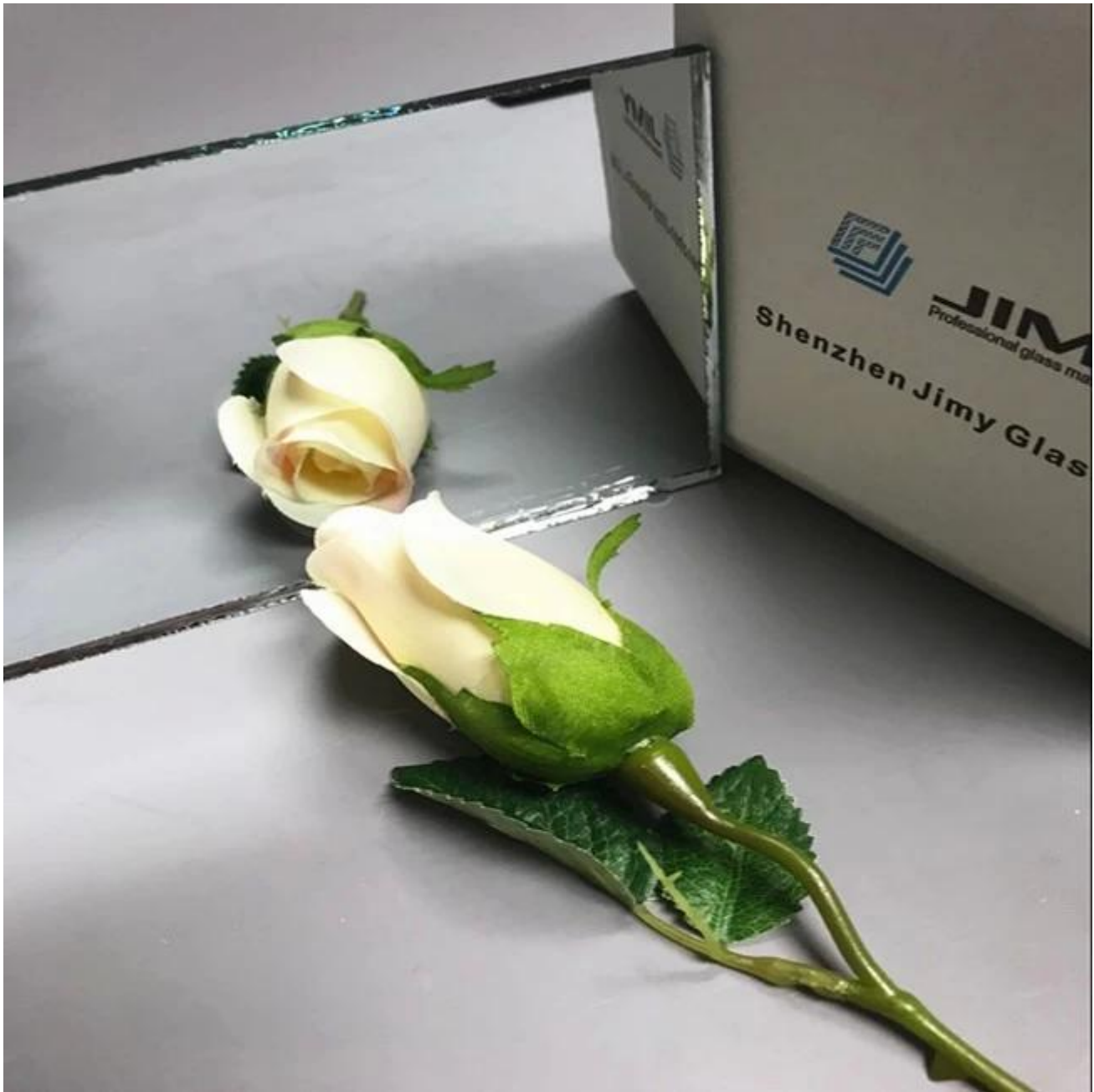
Anwendung von 6mm Aluminium Spiegelglas