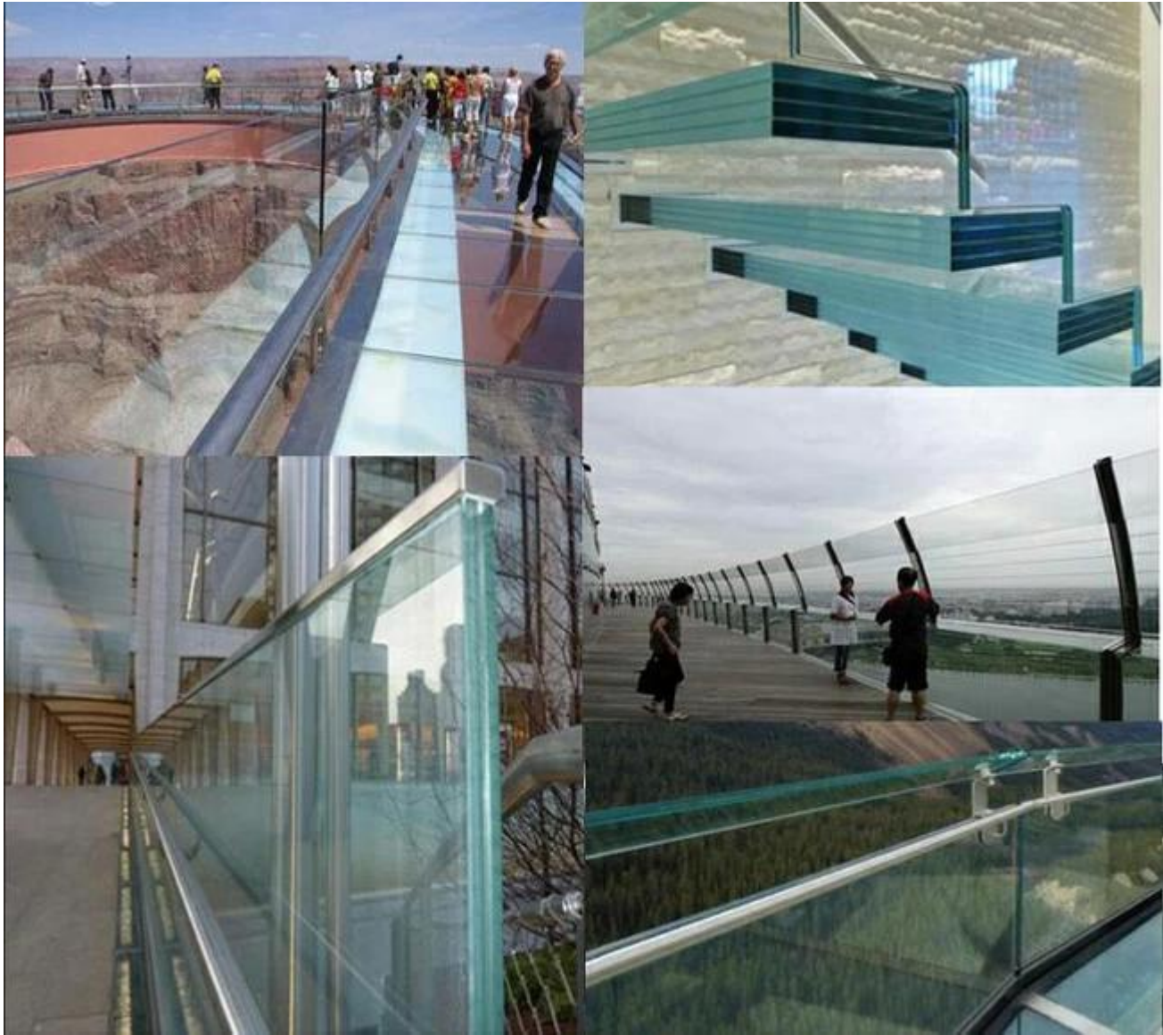
Verpackung von JIMY Glass Fabrik