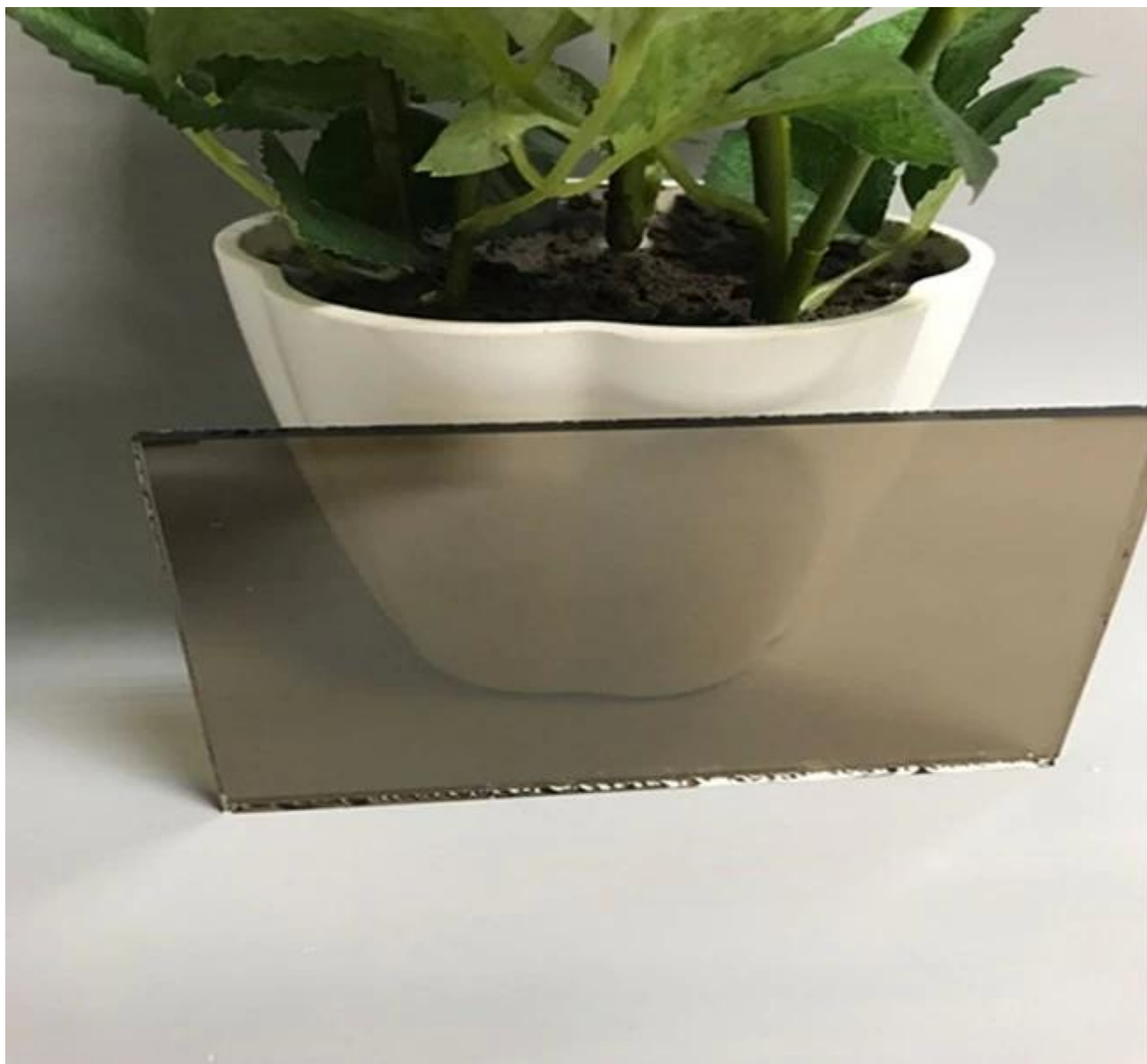
Lado espejo de vidrio reflectante de bronce Euro de 4mm