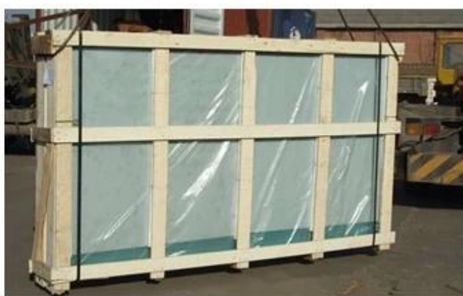
Vidrio tintado verde claro aplicación del glas del proceso: