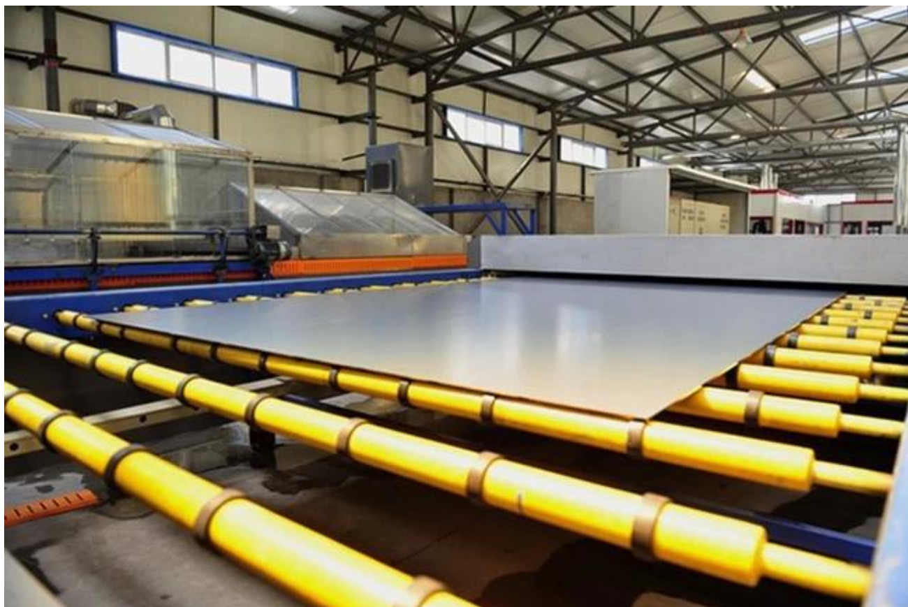
Espejo seguridad embalaje