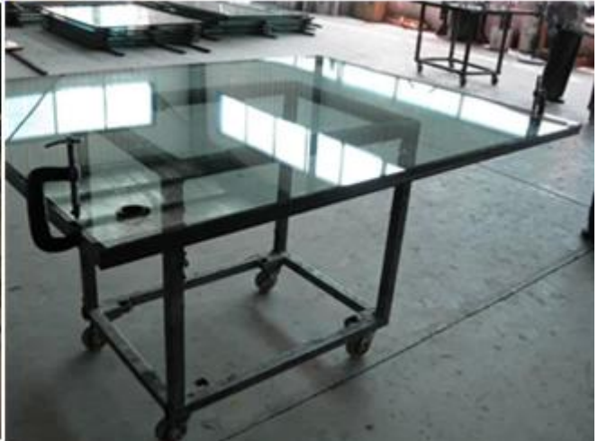
Aplicación de vidrio aislado Low E: