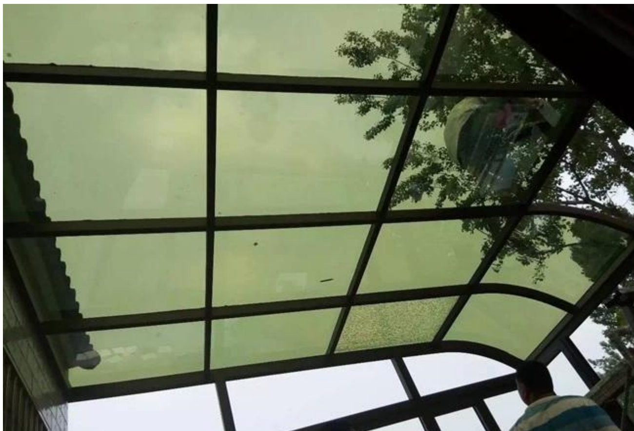
Seguridad de vidrio reflectante verde oscuro de 5mm de embalaje y carga