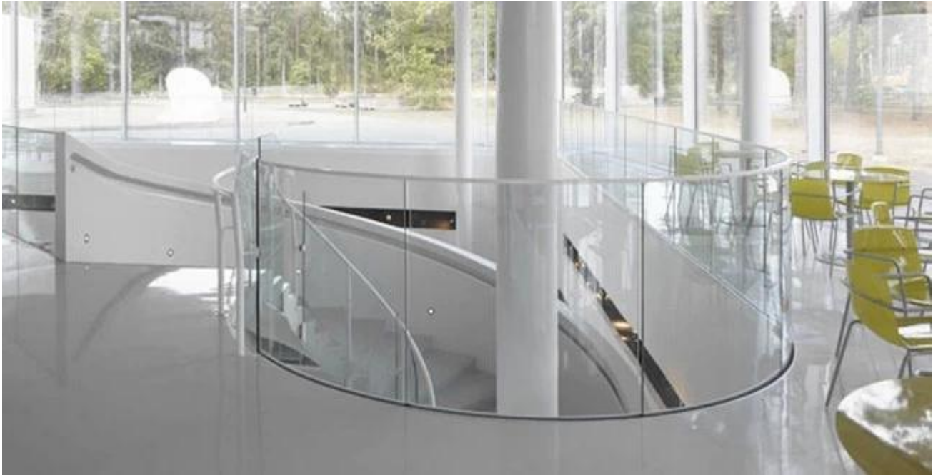
Curva de China máquina de vidrio templado