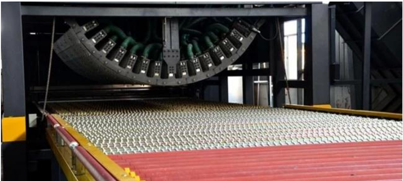
China curvado vidrio seguridad carga