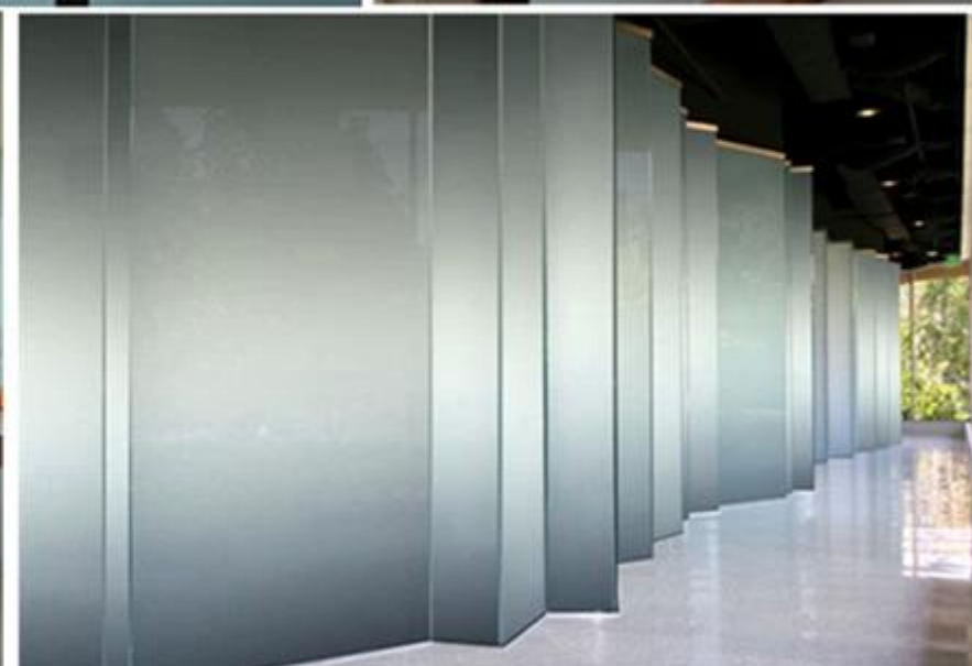
Alta calidad 4mm ácido grabado al agua fuerte cristal fotos: