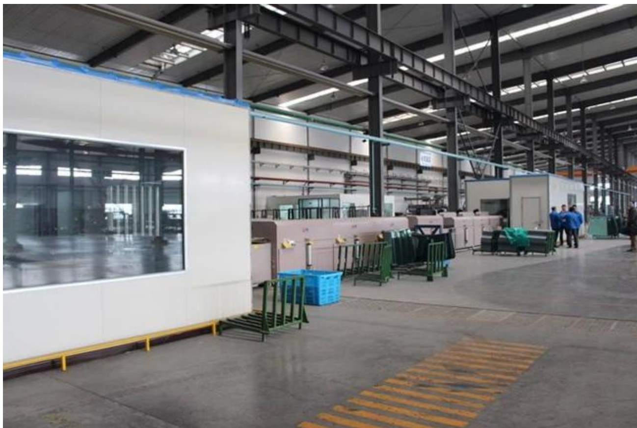
Color pantalla impresión cristal almacén