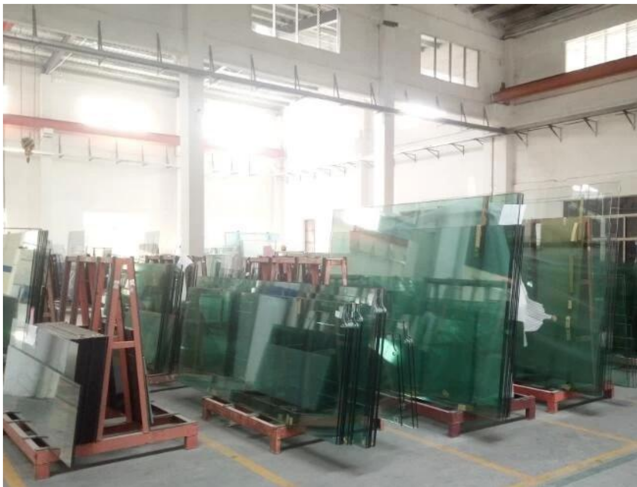
Lämpöä liotettu karkaistu lasi valmistaja Kiina