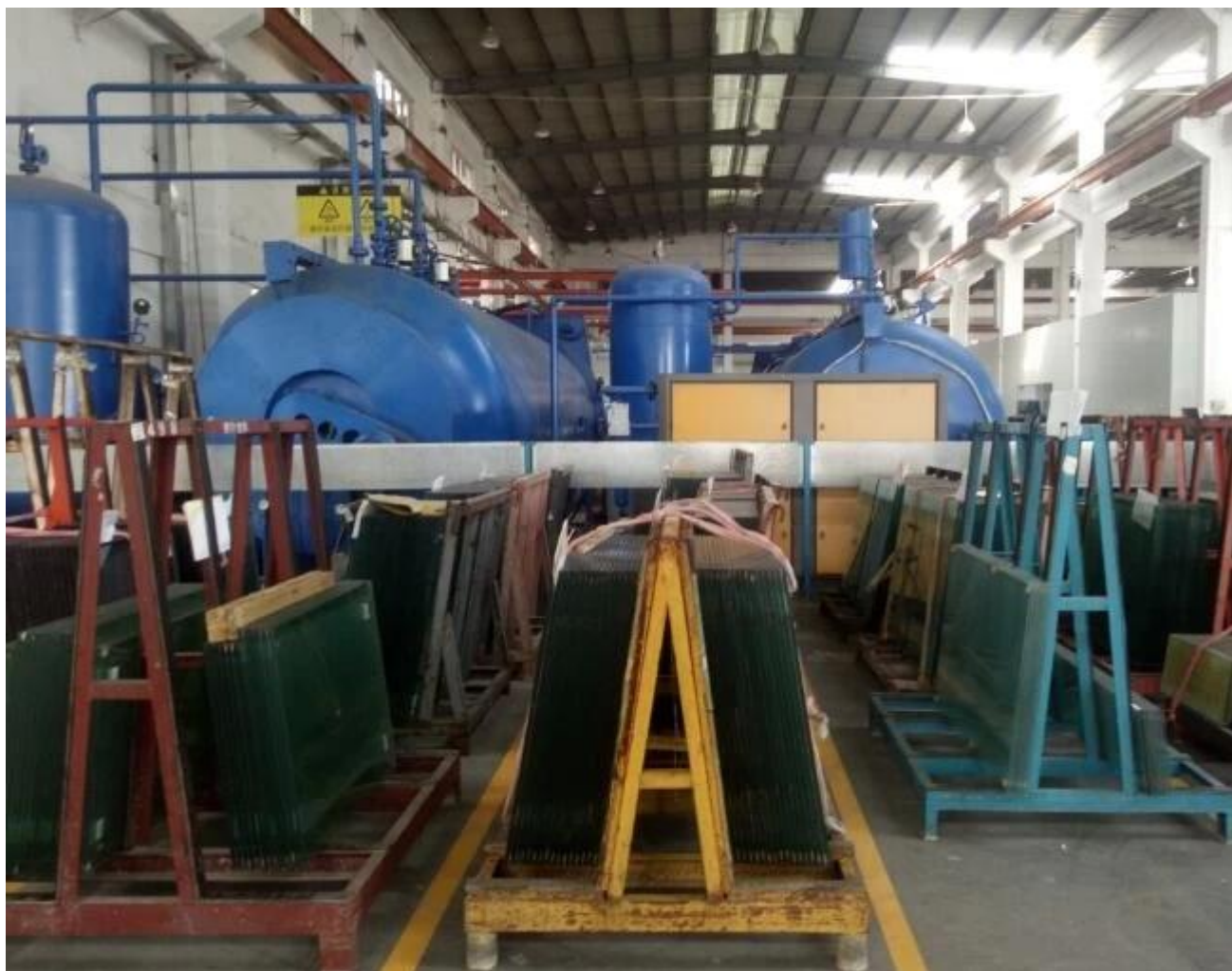
Säiliön täyttäminen JIMY Glass-tehtaalla