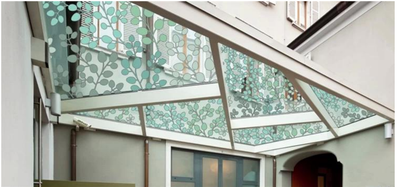
6 + 6mm läpinäkyvä silkkipainettu laminoitu lasi väliseinälle