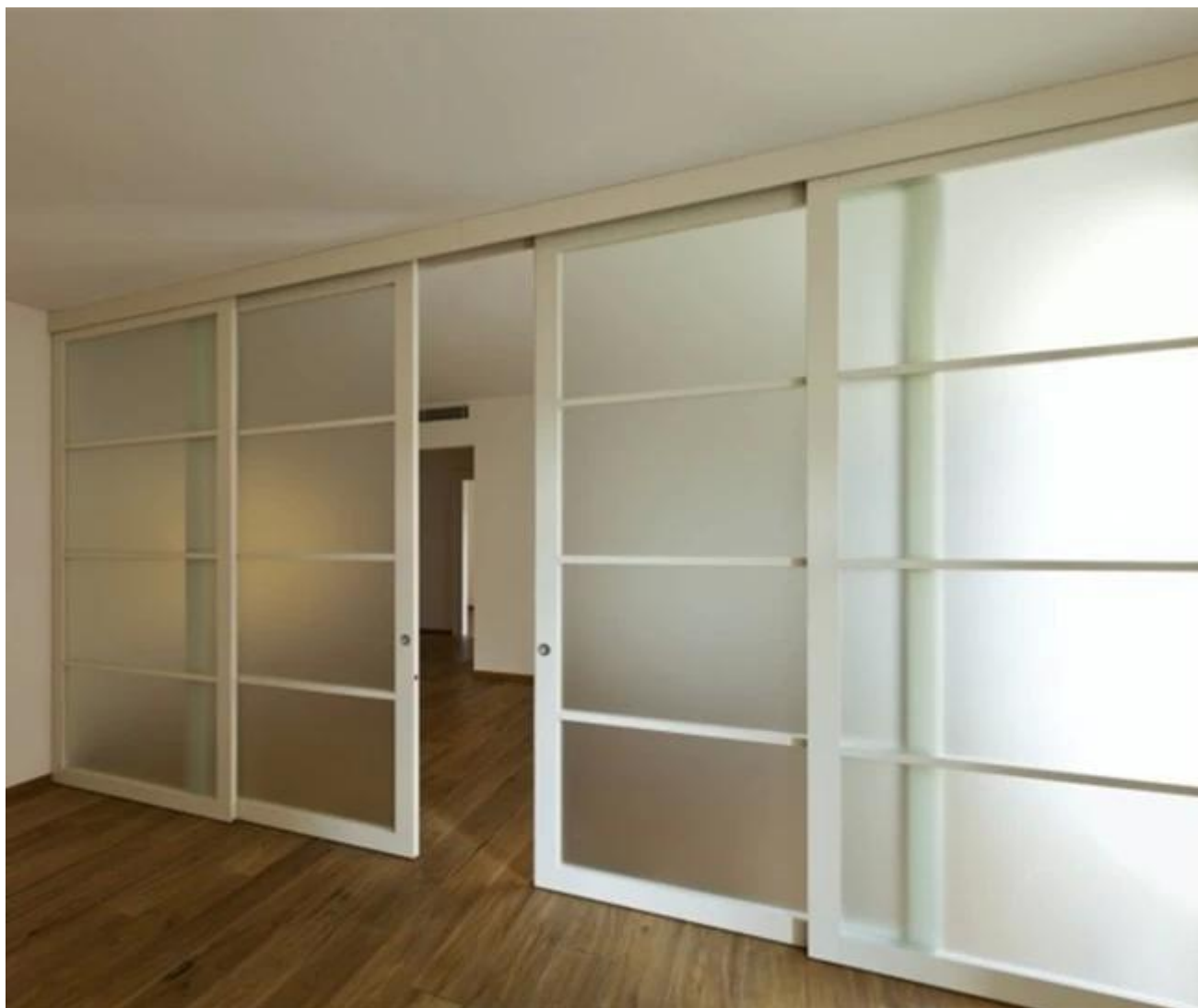
10mm jäälasi karkaistua makuuhuoneen ovi: