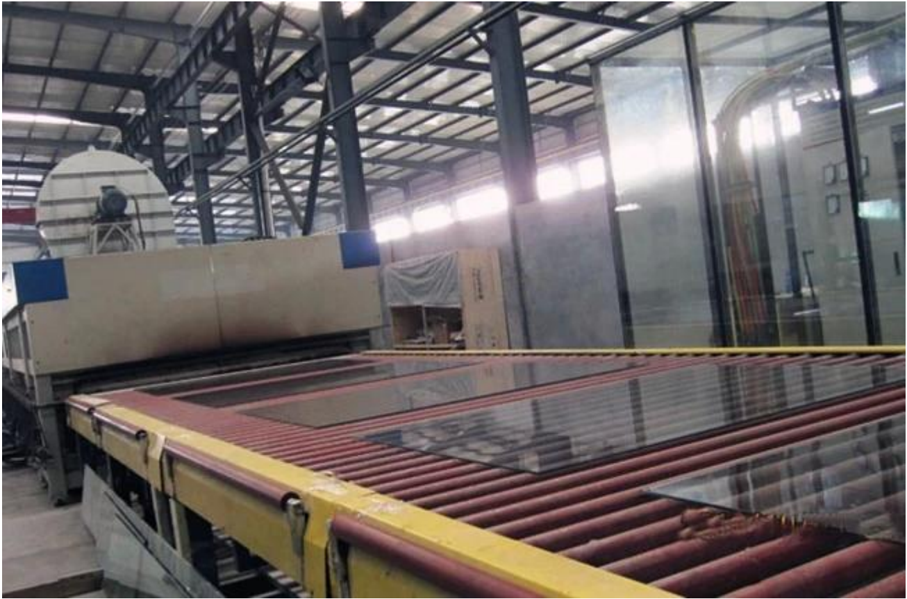
Pronssi heijastava lasivarasto