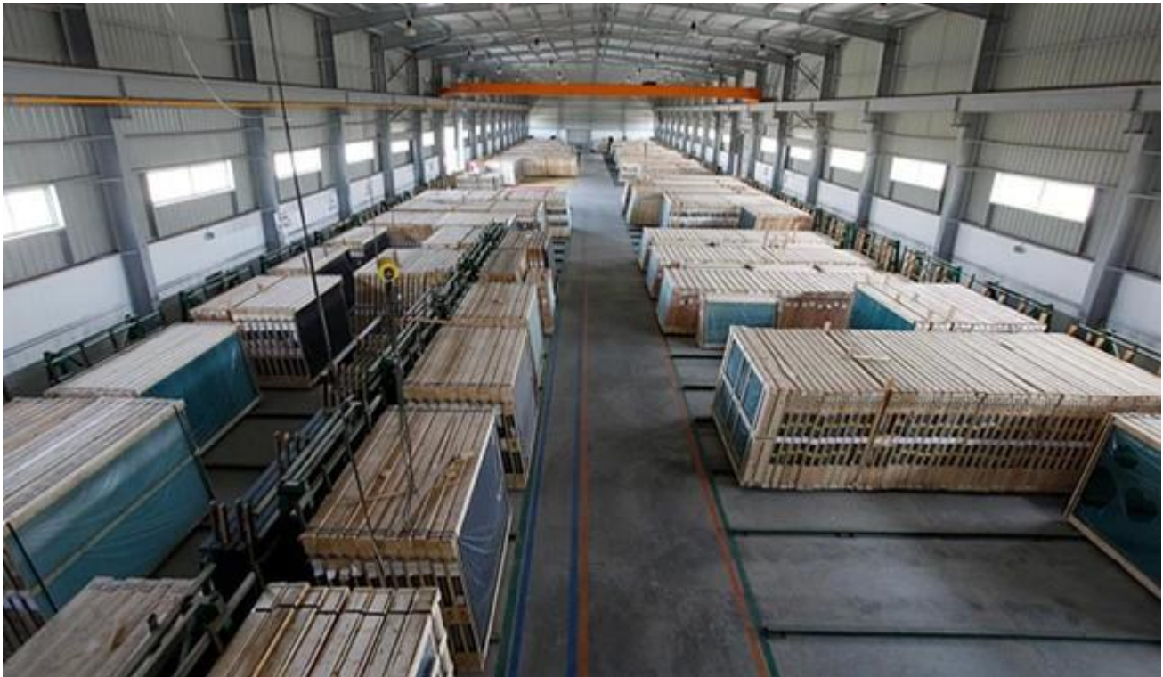
Pronssi heijastava lasi turvallisuuden lastaus