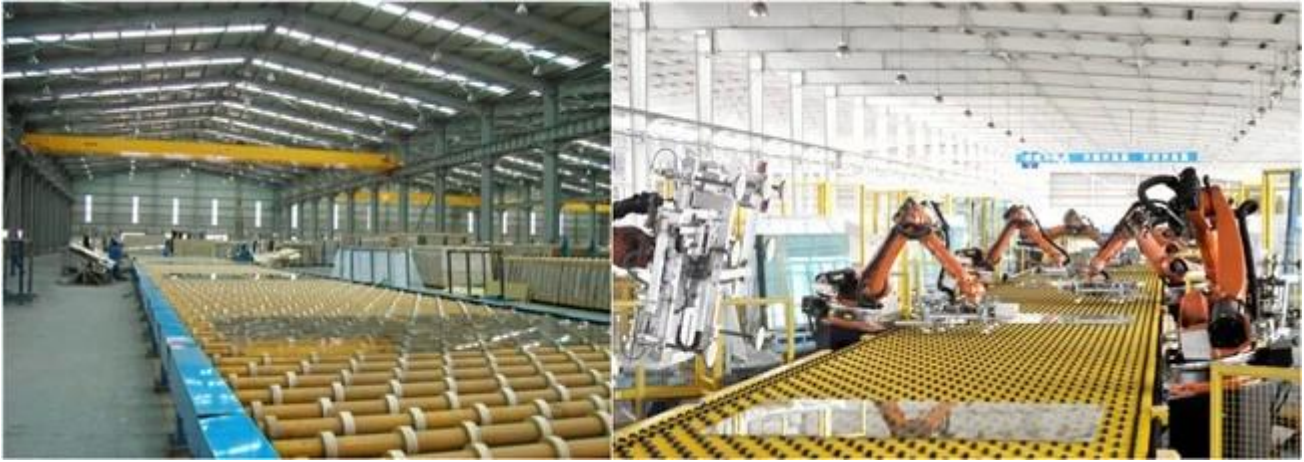
Poista Float lasi vahva pakkaus- ja turvallisuuden lastaus