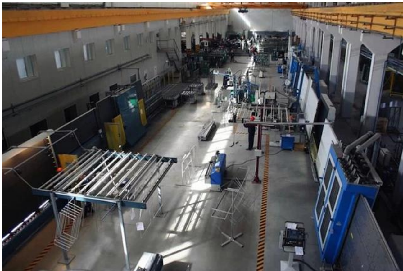
Chargement de sécurité vitrage isolant