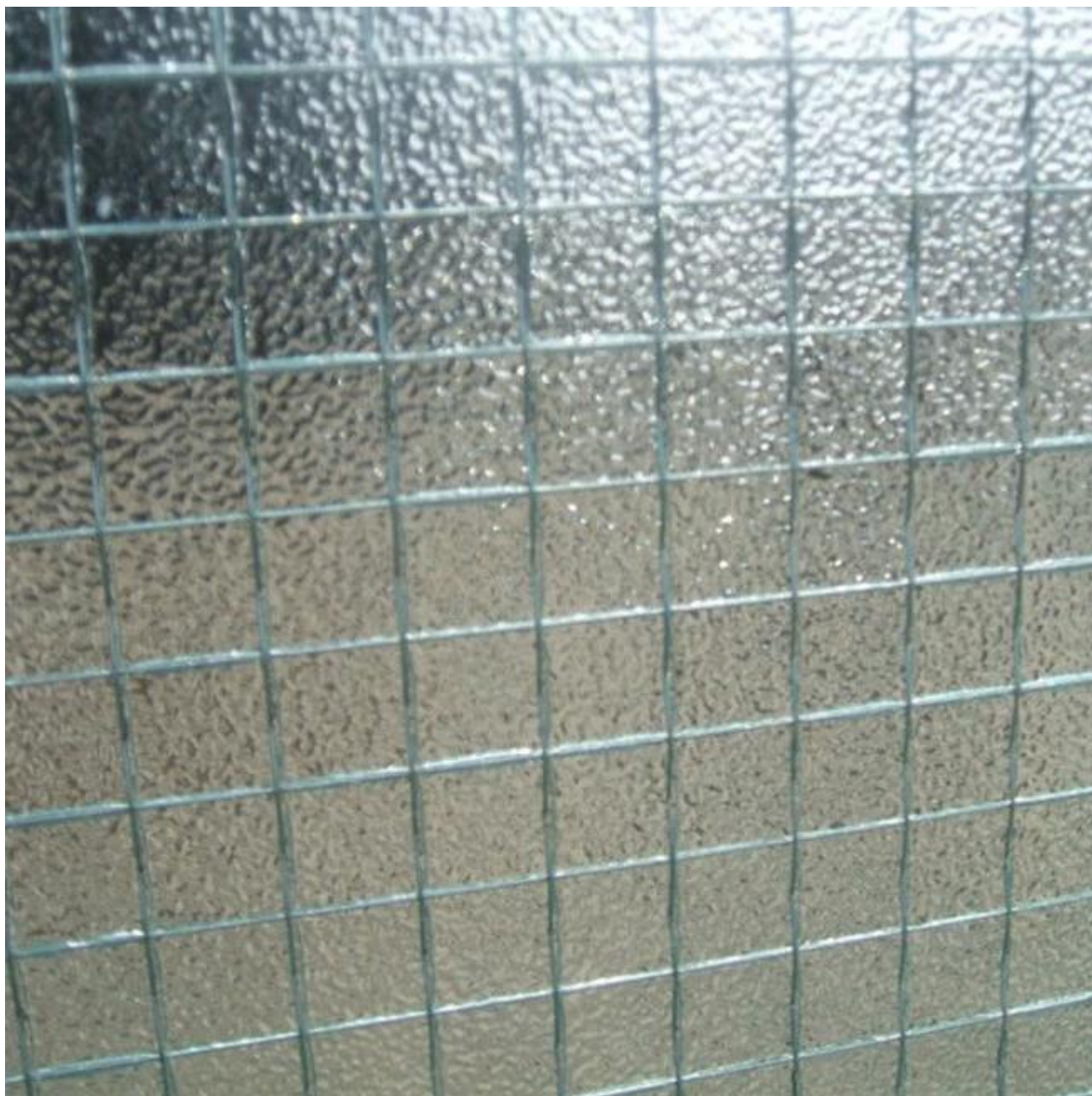
5mm ronde clair nashiji plateau en verre trempé