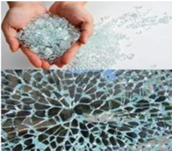
Toughened Glass broken into alveolate granules is human harmless