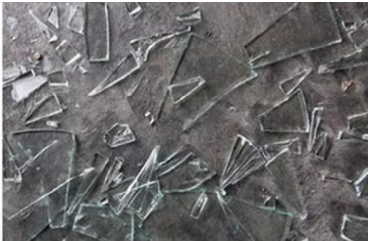
Annealed Glass when broken into sharp, easy to hurt human