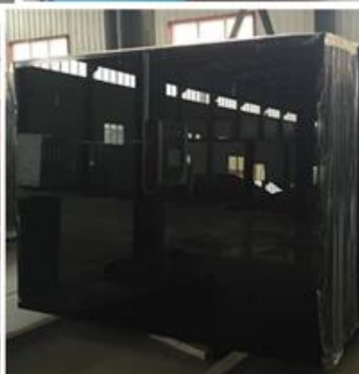
Production de verre incolore et entrepôt: