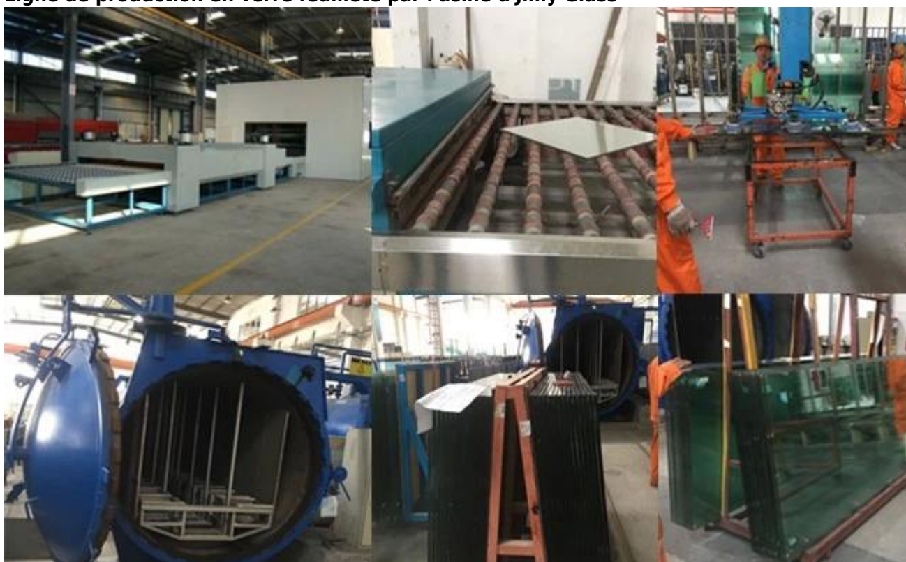
Les applications du verre de sécurité feuilleté 15 + 15 mm