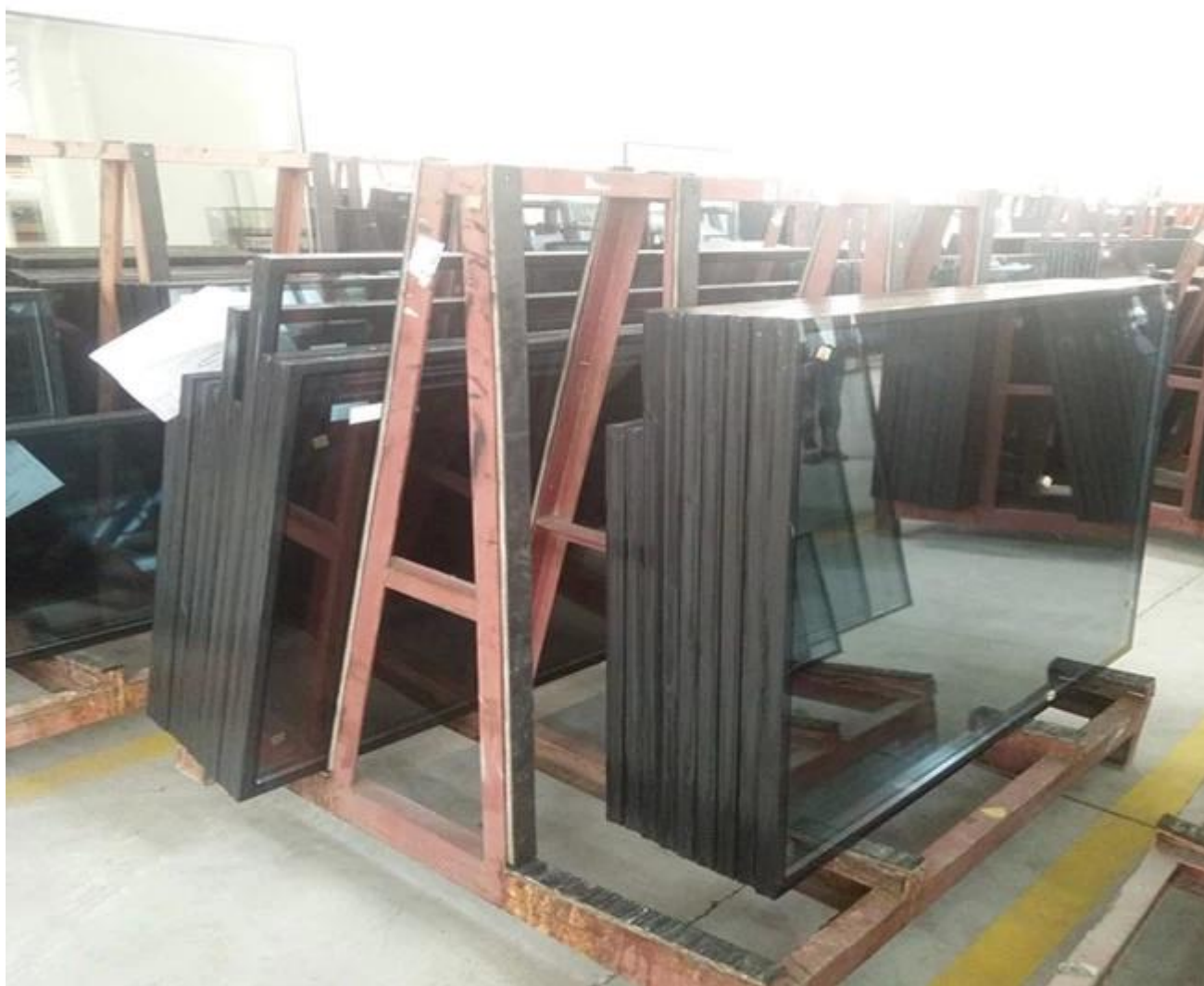
Photo du mur-rideau en verre isolé de bonne qualité