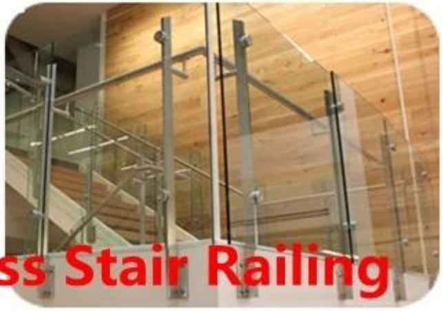
Trapezoidal Glass Stair Railing