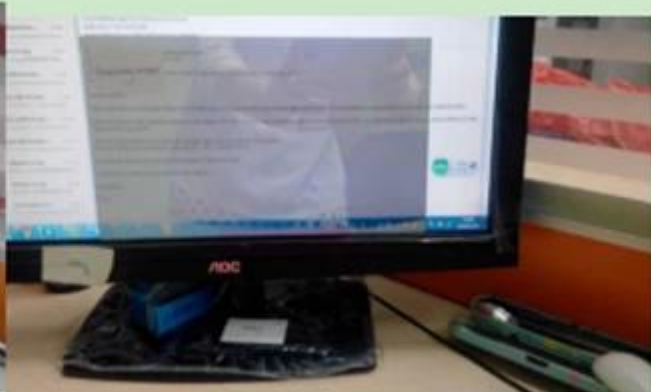
When computer on