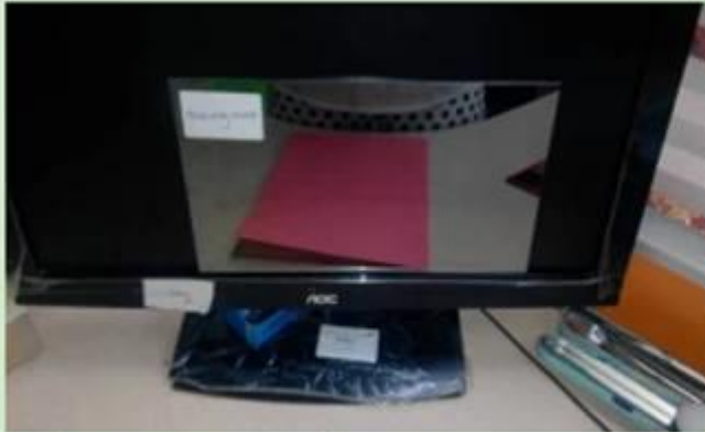
When computer off