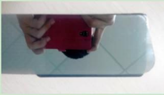
When cellphone off