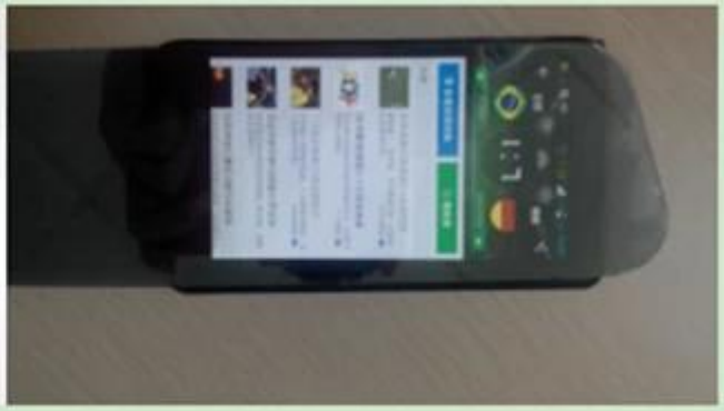
When cellphone on