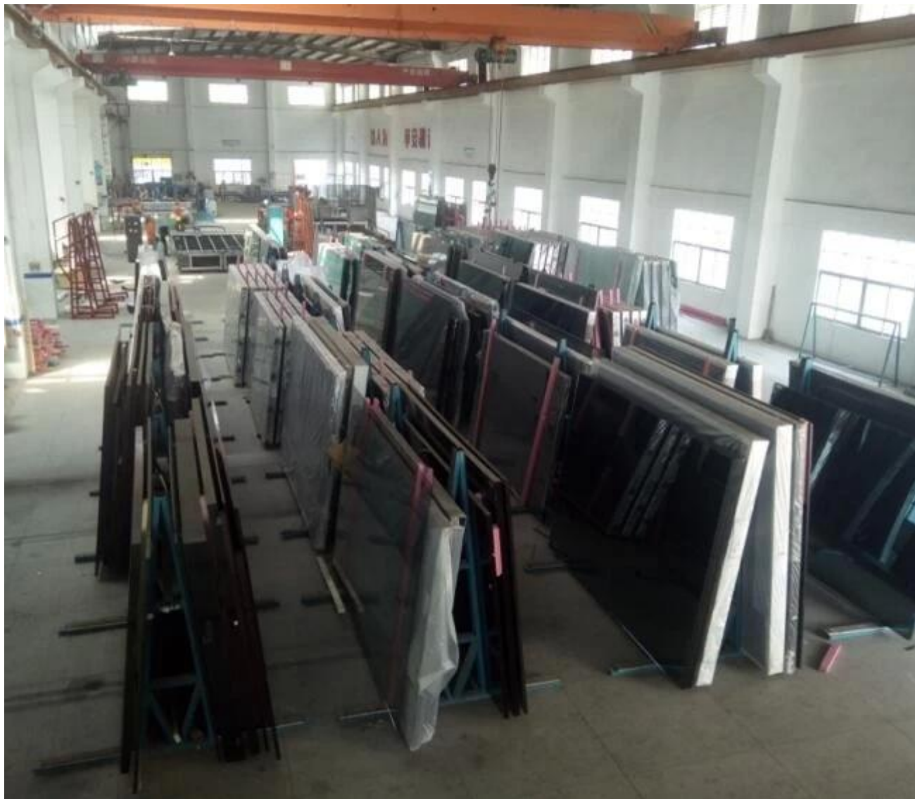
JIMY wyżarzane szkło laminowane szkło na ładowanie