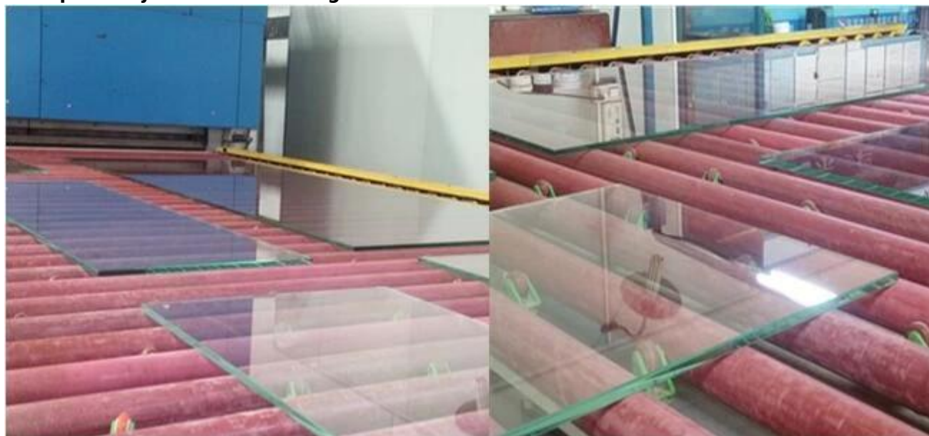
Magazyn ze szkła hartowanego wg Jimmy Glass