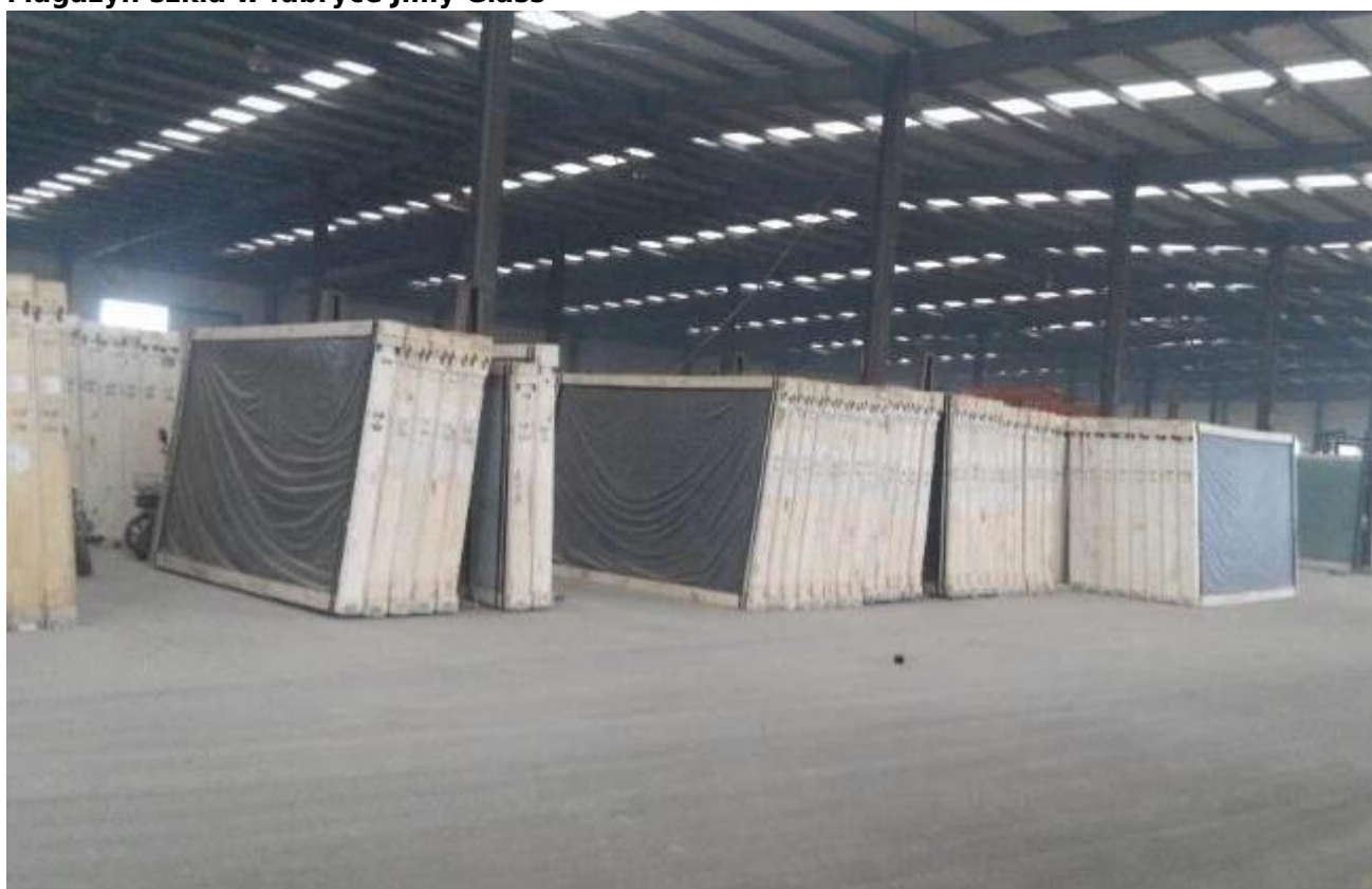
Ładowanie pojemnika przez fabrykę Jimy Glass