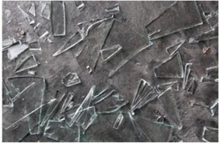
Annealed Glass when broken into sharp, easy to hurt human