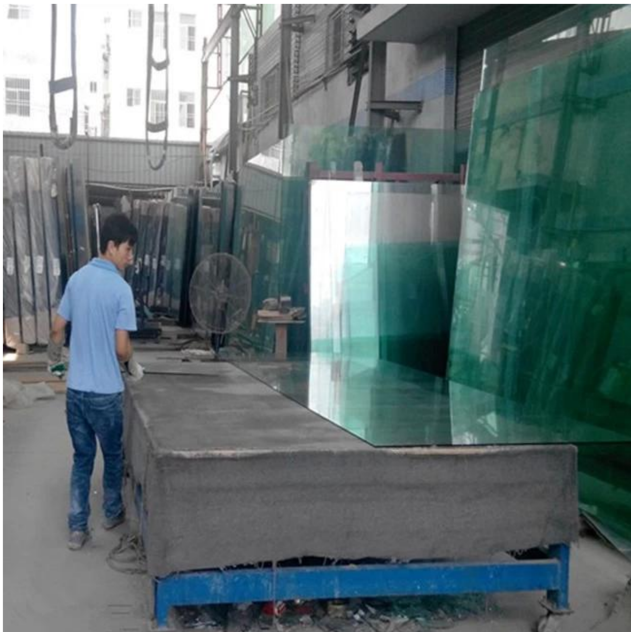
Kiedy różnica wyżarzane szkła i potłuczone szkło hartowane