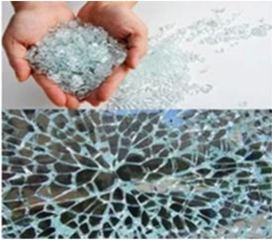
Toughened Glass broken into alveolate granules is human harmless