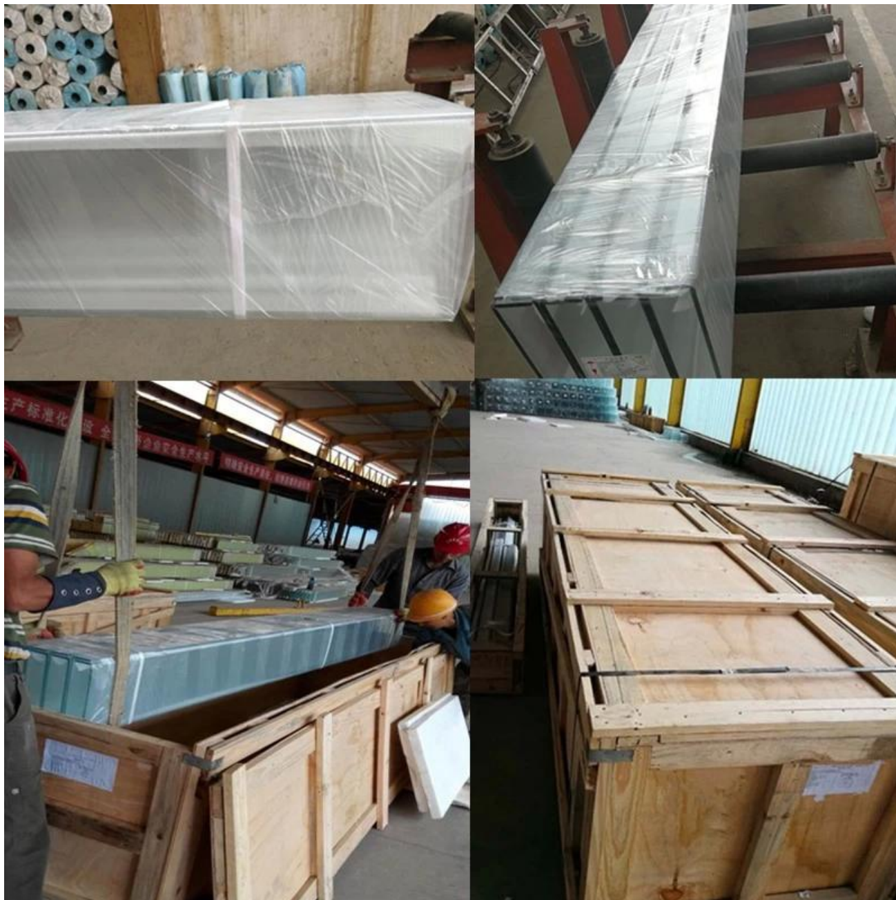
Ściana szklana ze szkła hartowanego