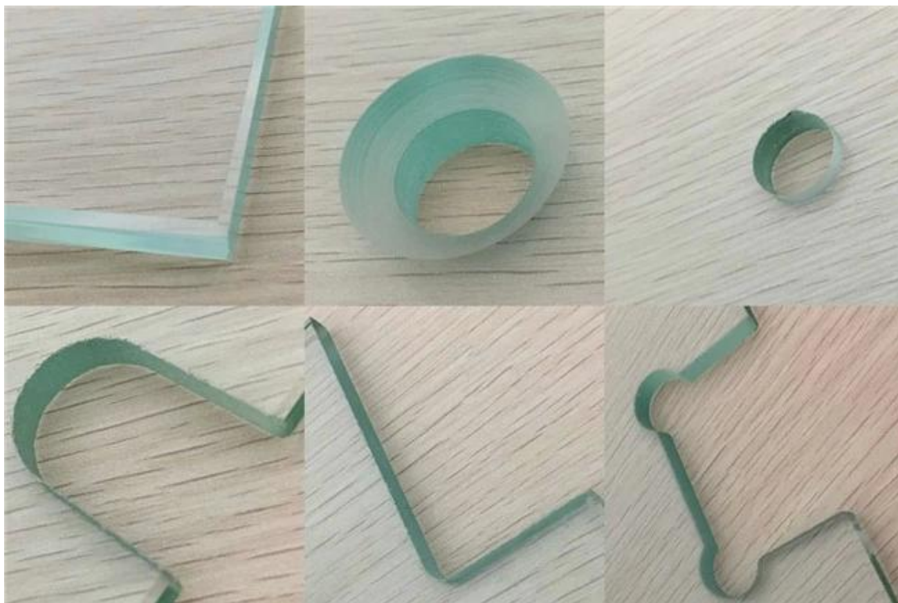
Obróbka krawędzi szkła hartowanego i maszyny.