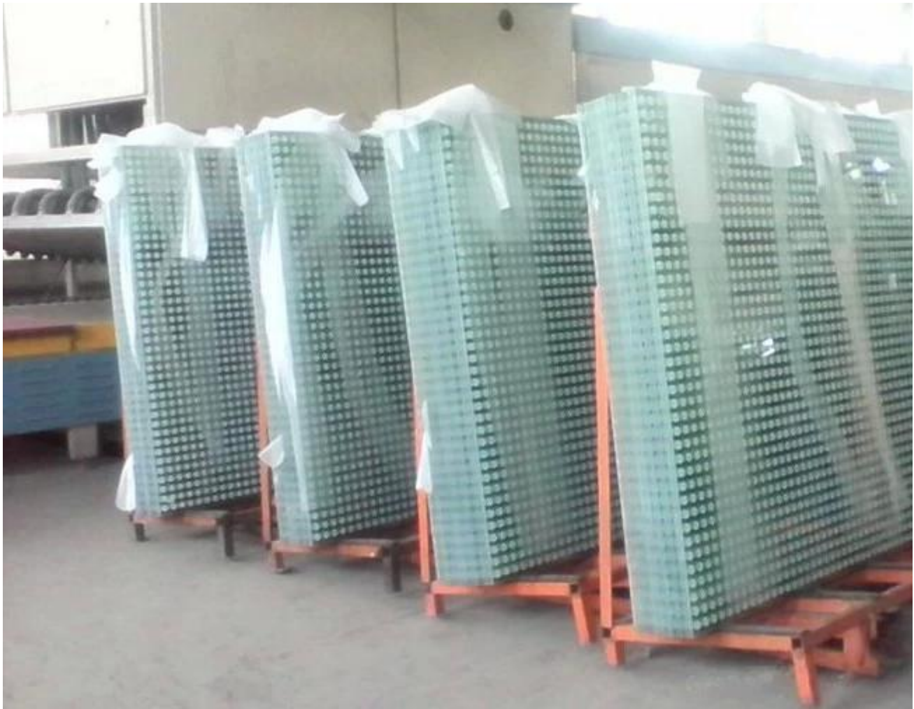
Sitodruk, druk Glass Workshop