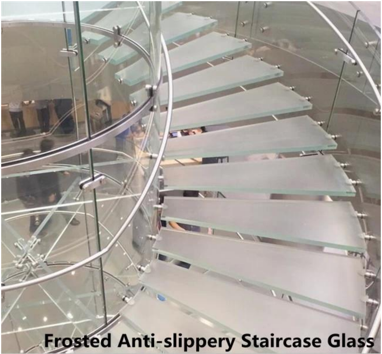
Frosted Anti-slippery Staircase Glass