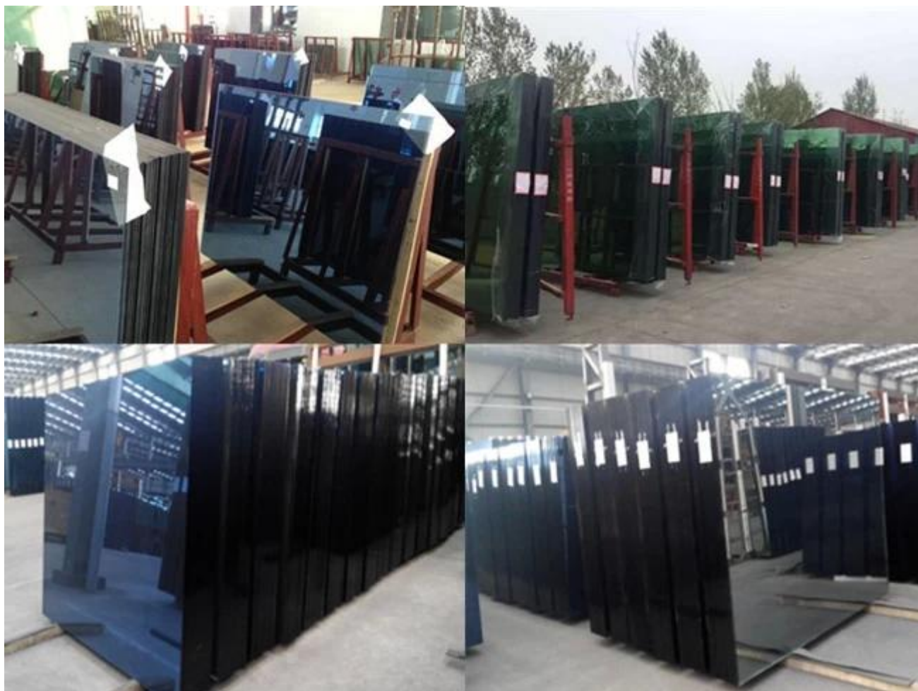
Opakowanie fabryczne Jimy Glass