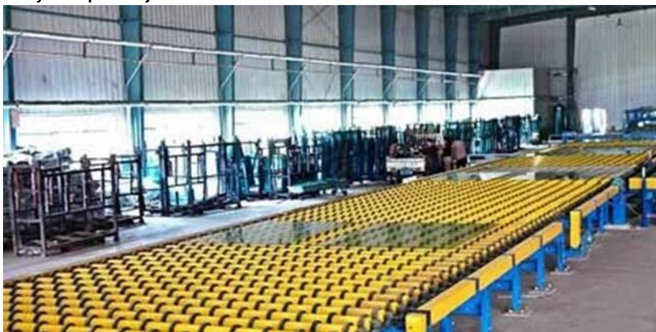
Na powierzchnię nalej opakowań szklanych i magazyn: