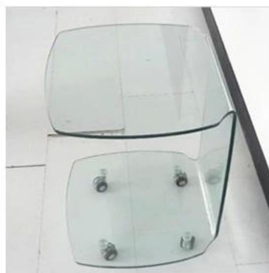
Embalagem e carregamento de segurança em vidro dobrado