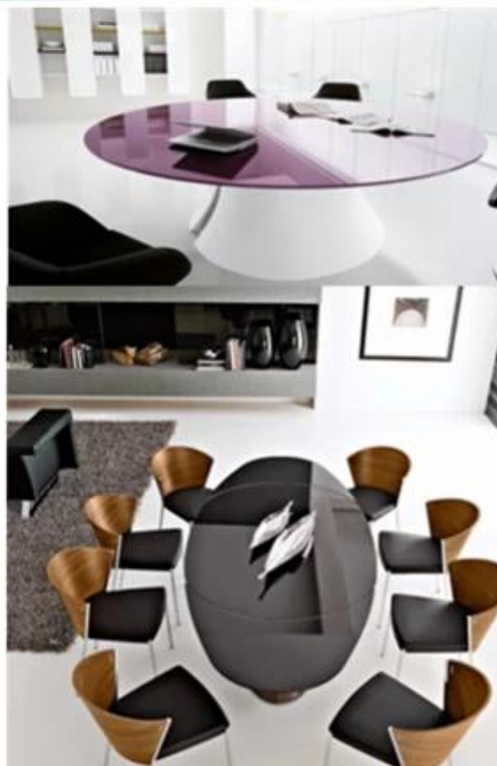
Utilização de vidro moderado 12mm personalizados para mesa de escritório: