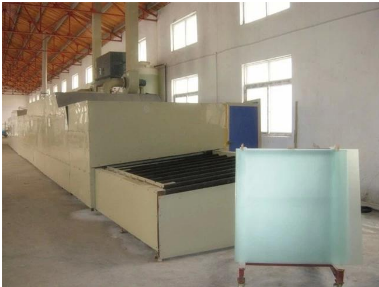
Ácido gravado vidro embalagem forte