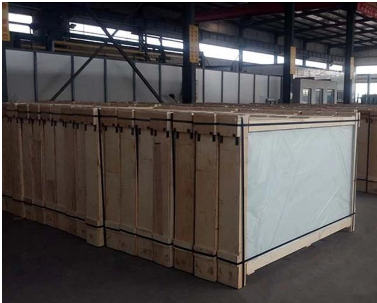
Tamanho padrão ácido gravado vidro de segurança de carga