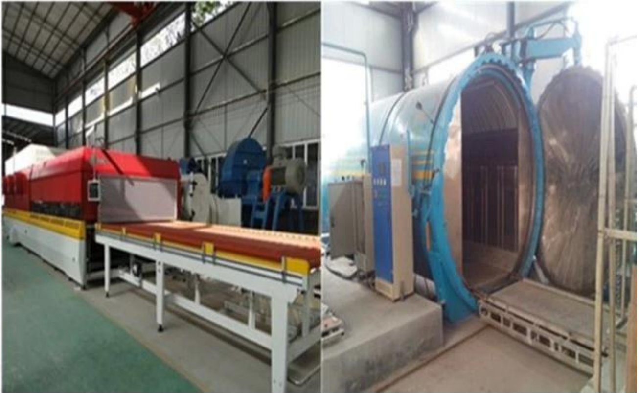
Pacote forte de vidro HST